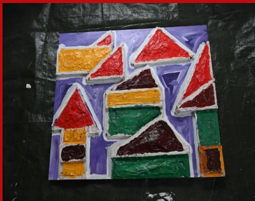
TOWN AND ROOM [2]

Besuchszeiten: MO bis SO 8:00 – 16:00 ERDGESCHOSS