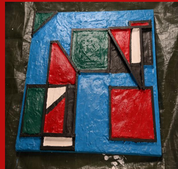
DIE ANTI - FABRIK