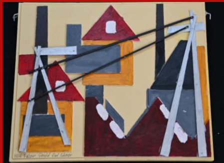
ENERGY WITH TOWN AND FACTORY