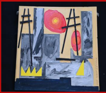
DIE ENERGIE - WENDE