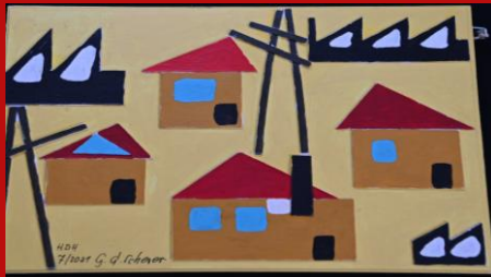
TOWN OWN AND FACORY